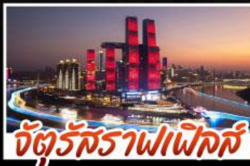
จัตุรัสราฟาเอล