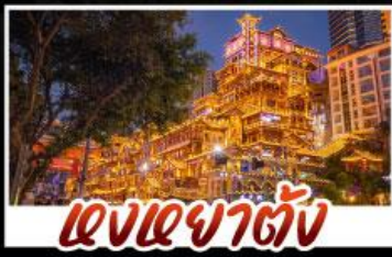
แสงเซาตัน

สัมผัสประสบการณ์เที่ยวจีนแบบเต็มอิ่ม ทั้งความล้ำสมัยของมหานครชิง และความงามตาตระการตาของธรรมชาติที่อู่หลง ทุกการเดินทางเต็มไปด้วยความสะดวกสบายและคุ้มค่าที่สุด!