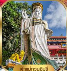
เจ้าแม่กวนอิม พลัสเบย์