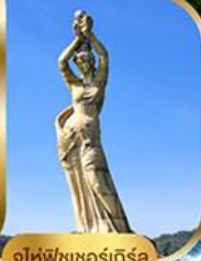
จูไห่ฟิชชอร์ทิวรา