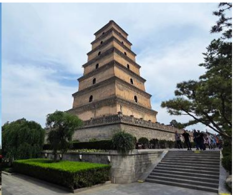
เจดีย์ห้าบาใหญ่

หลังอาหารนำท่านเดินทางสู่ นครซีอาน (ระยะทาง 50 กม ใช้เวลาเดินทางราว 1 ชั่วโมง) นำท่านชม เจดีย์ห้าบาใหญ่ 大雁塔 เจดีย์โบราณนี้เป็นแลนด์มาร์คที่โดดเด่นของนครซีอาน ตั้งอยู่ทางทิศใต้ ของกำแพงเมืองซีอาน เป็นโบราณที่มีความสำคัญทางศาสนา ที่แสดงถึงความรุ่งเรืองของพุทธศาสนาในแผ่นดิน จีน หลังจากที่พระถังซำจั๋งเดินทางไปยังชมพูทวีปเพื่ออัญเชิญพระไตรปิฎกกลับมายังแผ่นดินจีน ท่านก็ได้พำนัก ที่วัดต้าเจียนและเป็นเจ้าอาวาสของวัดนี้ จากนั้นได้มีการสร้างเจดีย์ 5 ชั้นเพื่อใช้ในการเก็บรักษาพระไตรปิฎก ที่