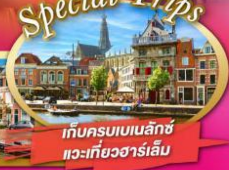
เก็บครบเบเนลักซ์ แวะเที่ยวซาร์เล็ม