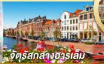
จตุรัสกลางซาร์เล็ม