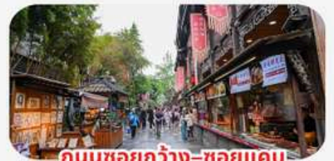
ถนนชอยกว้าง-ชอยแคบ