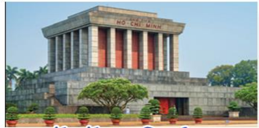
จัตุรัสบาติงห์