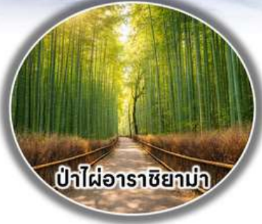
ป่าไผ่อาราชิยาม่า