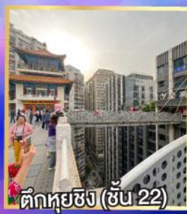
ตึกหุ่ยซิง (ชั้น 22)