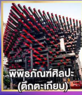
พิพิธภัณฑ์ศิลปะ (ตึกตะเกียบ)