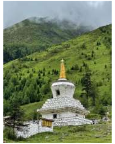
ที่สวยงาม อิสระพักผ่อนชมวิวะระหว่างทางจน