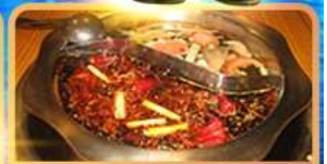
สุกี้ท้องถิ่น