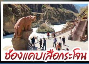
ช่องแคบเสือกะโจน