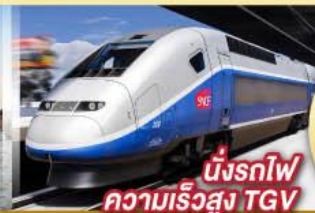
นั่งรถไฟความเร็วสูง TGV