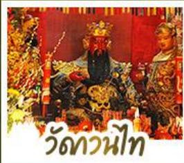
วัดกวนน้้ท