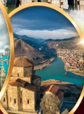
อารามจวารี

ทบิลีซี มิทสเคต้า คาซเบกกี กูดาอูรี กอริ อพลิสต์ซิเคห์ คูไตซี บากูมิ