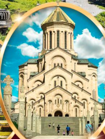
วิหารซาเมบา