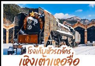
โรงเก็บข้าวตกร, เจียงเต่าแฮจิว