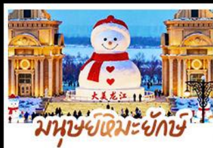
มนุษย์หิมะยักษ์