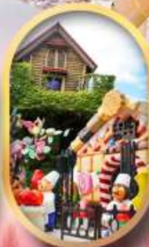
โรงงานช็อกโกแลต