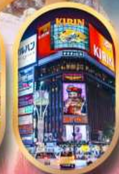
ช้อปปิ้งย่านซูซุกิโนะ