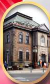
พิพิธภัณฑ์กล่องดนตรี