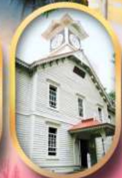
ผ่านชมหอนาฬิกา