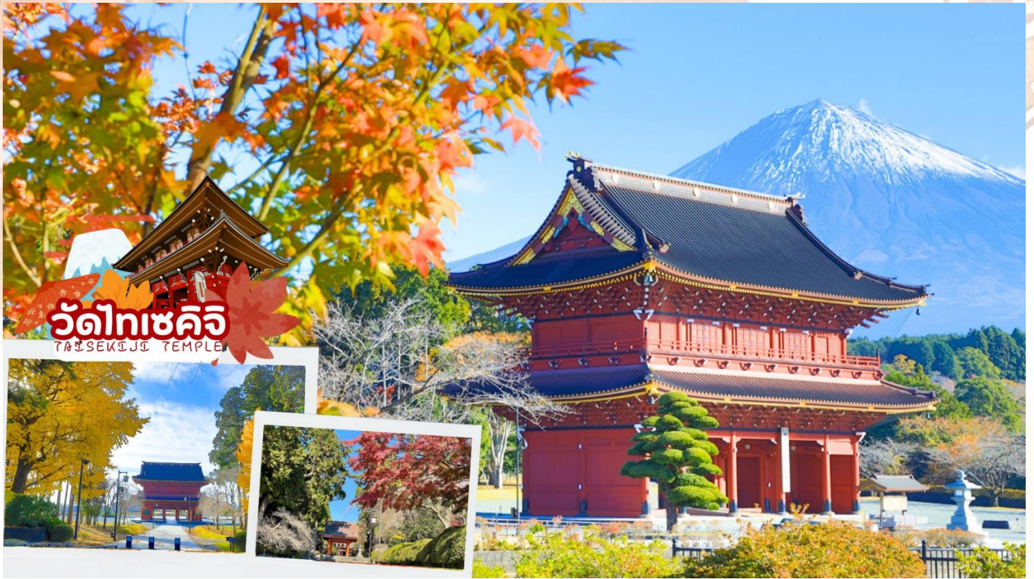
วัดไทเซคจิ TAISEKIJI TEMPLE

จากนั้นเดินทางต่อสู่ เมืองนาโกย่า เป็นเมืองที่มีประวัติศาสตร์มายาวนาน เป็นเมืองใหญ่ที่สุดในภูมิภาคจูบุ ซึ่งอยู่ตรงกลางของประเทศญี่ปุ่น มีสถานที่ท่องเที่ยวมากมาย ทั้งสถานที่ท่องเที่ยวทางประวัติศาสตร์ และสถานที่ท่องเที่ยวทางธรรมชาติ