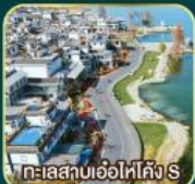
ทะเลสาบเอ๋อไห่คัง S