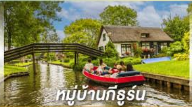
หมู่บ้านทึร์สุน