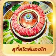
สุกใสโตลมองโก