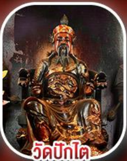
วัดปิกไต้