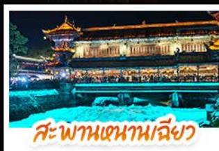
สะพานเทียนเฉียว