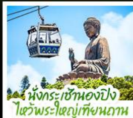
เน็กระเซ้าเองปิง ไฮวีพระใหญ่เทียบทาน