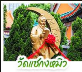
วัดเซ่งก้งเมิว