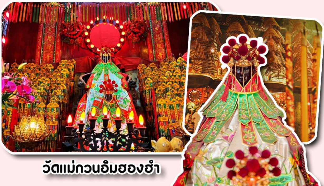
วัดแม่กวนอิมฮองฮำ

พาท่านเดินทางไปไหว้ขอพรขอเงิน วัดแม่กวนอิมฮองฮำ วัดเก่าแก่ของฮ่องกงสร้างตั้งแต่ปี ค.ศ. 1873 เป็นวัดขนาดเล็กที่มีชาวฮ่องกงศรัทธานับถือกันเป็นอย่างมาก วัดแห่งนี้เป็นที่ประดิษฐาน องค์เจ้าแม่กวนอิมฮองฮำ ที่มีชื่อเสียงเรื่องการให้กู้ยืมเงิน เชื่อกันว่าท่านช่วยพลิกฟื้นเศรษฐกิจของชาวฮ่องกง ผู้คนจึงนิยมมาเยี่ยมเงินทำธุรกิจจนสำเร็จร่ำรวย รุ่งเรือง โดยให้ท่านอธิษฐานขอพรต่อหน้าเจ้าแม่กวนอิมฮองฮำ พร้อมกับระบุวันเวลาในการขอพรด้วย จากนั้นนำธนบัตรตามฐานะและศรัทธาที่เราจะนำเป็นสื่อในการขอพร เขียนจำนวนเงินที่ต้องการลงไปด้วย ใส่สกุลเงินยี่งดีใหญ่ แล้วนำเงินใส่ในซองแดง ควรเตรียมซองแดงไปเอง นำซองแดงไปวนรอบกระถางรูป วนขวาจำนวน 3 ครั้ง แล้วเก็บซองแดงในกระเป๋าสตางค์ เป็นเงินขวัญถุง ถ้าประสบความสำเร็จตามที่มุ่งหวังให้นำเงินในซองแดงทำบุญหยอดตู้ที่วัดแห่งนี้ในโอกาสต่อไป วิธีไหว้ให้ปัง ให้ได้โชคลาภเงินทอง ต้องไปกับเราเท่านั้น