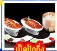
เปิดปิกกิ้ง