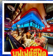
บุฟเฟต์ซีฟู้ด