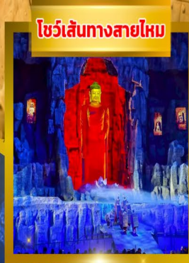
โชว์เส้นทางสายไหม