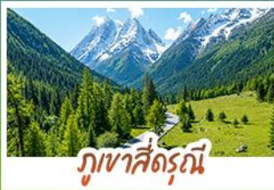
ภูเขาซีดรุณี