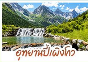
อุทยานปีผิงโกว