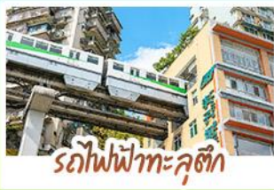
รถไฟฟ้าทะเลสาบซีจื่อ

ชมธรรมชาติ ณ อุทยานแห่งชาติผิงโกว ชมหมู่บ้านสุดอลังการระดับมรดกโลก นั่งรถไฟฟ้าทะเลสาบซีจื่อป้า สัญลักษณ์เมืองฉางชุนสุดล้ำ สัมผัสวิถีภูเขาหิมะแห่ง ภูเขาซีดรุณี งดงามจนได้รับฉายา "เทือกเขาแอลป์แห่งตะวันออก" ชมธรรมชาติสุดฟิน ณ อุทยานปีผิงโกว • ช้อปปิ้งจุใจ ถนนคนเดินไท่กู่หลี่, ถนนคนเดินซุนซีลู่