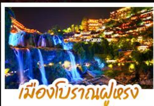
เมืองโบราณผู่เฉิง