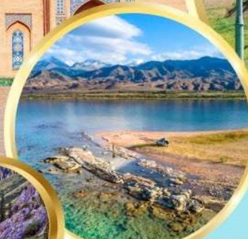
ล่องเรือทะเลสาบอิสซิค