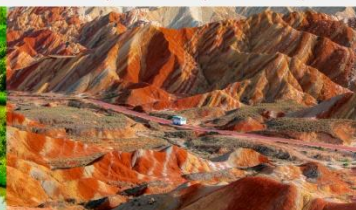
ภูเขาสายรุ้งจางเย่ต้นเสี่ย