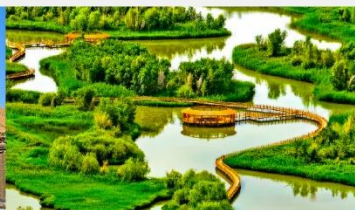
อุทยานพื้นที่ชุ่มน้ำจางเย่