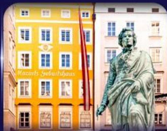
บ้านเกิดโมสาร์ท ซาลซ์บูร์ก