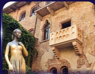
เขื่อนบ้านจูลีเยต เวโรนา