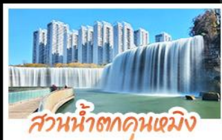
ส่วนน้ำตกคุณหมิง