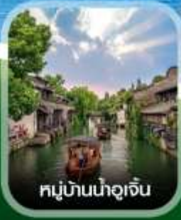
หมู่บ้านน้ำอู๋เจิน