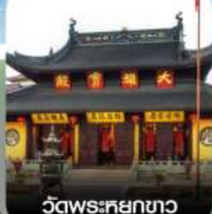
วัดพระศยกขาว