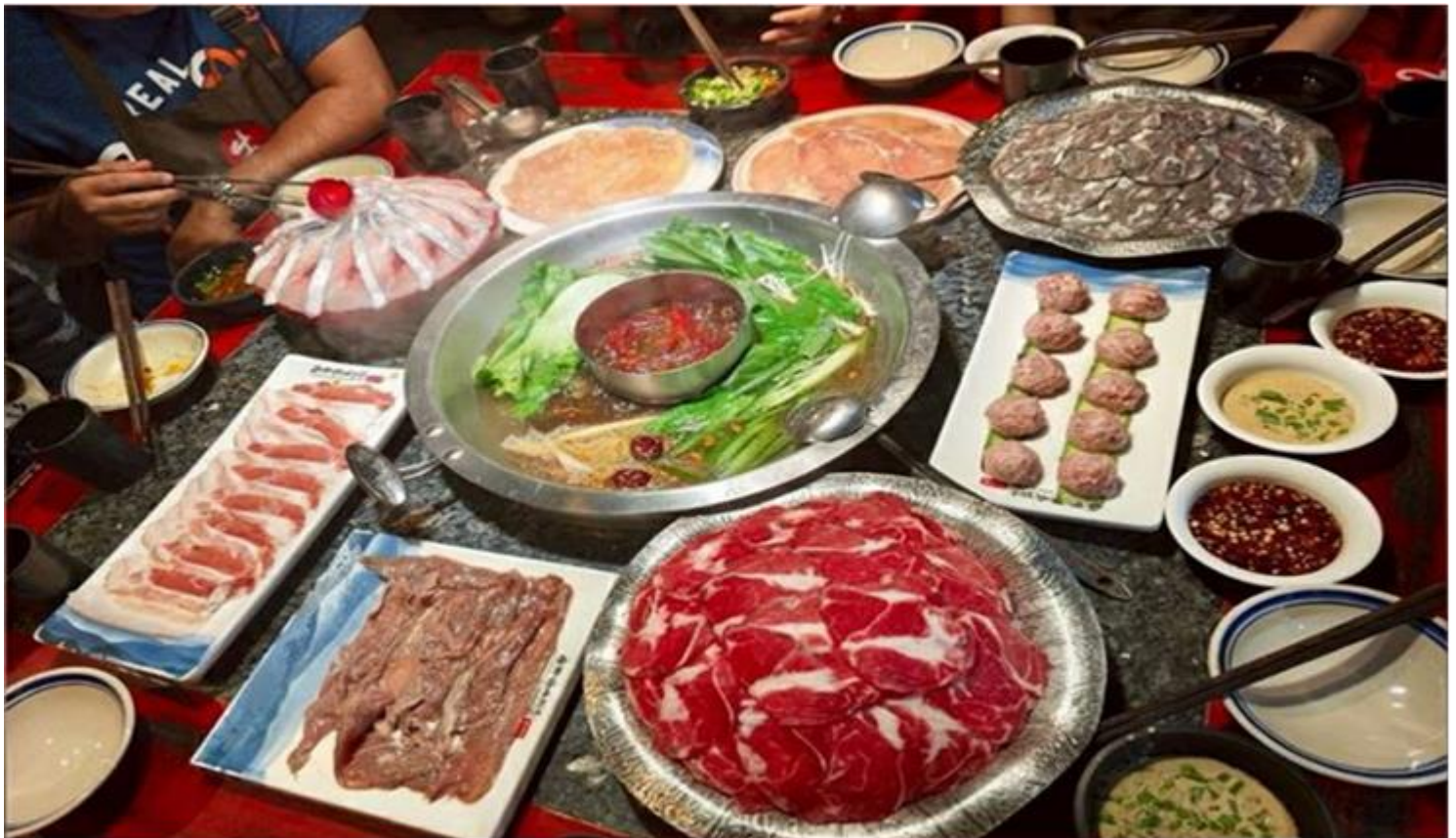
คำ รับประทานอาหารคำ ณ ภัตตาคาร (เมื่อที่ 12) *เมนูพิเศษสุกี้หมอลำเสวน

ดั้งเดิม มีทั้งแบรนด์แฟชั่นระดับโลกอย่าง Gucci, Chanel, Balenciaga รวมถึงร้านค้าไลฟ์สไตล์และแฟชั่นท้องถิ่น อาหารท้องถิ่นและคาเฟ่นานาชาติสวยๆ ที่เหมาะสำหรับการนั่งพักผ่อน