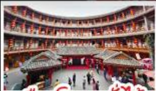
เมืองโบราณลั่วไต้