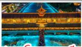
สะพานโบราณหนานชิว

อุทยานคำกู่ปิงชว่น - อุทยานสี่ตรุณี - หมี่แพนด้าเซลฟี่ ป่าฟิโนโตติก SKP - อุทยานปีศาจโกว - สะพานโบราณหนานชิว สตรีทอาร์ต Eastern Suburb Memory - เมืองโบราณลั่วไต้ เบมูพิศข มื้อไฟหมาล่า