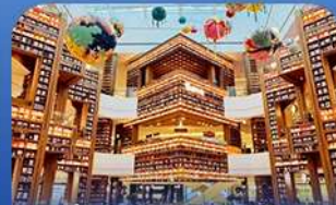
ต๋องสมุดสตาร์ฟิค