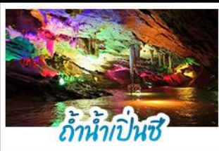
ลำน้ำปิ่นซี

แถมตั๋วเครื่องบิน 5 นก...ชมเวนิสตาหสิยนสุดปัง เยือนชายแดนตางสุดควลง ล่องทำน้ำเป็นซีสุดอลัง ยอนรอยวงเลินหยางกุกัง