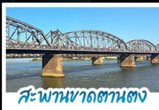
สะพานขาดตางตง