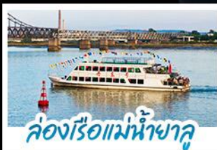
ล่องเรือแม่น้ำชาลู่