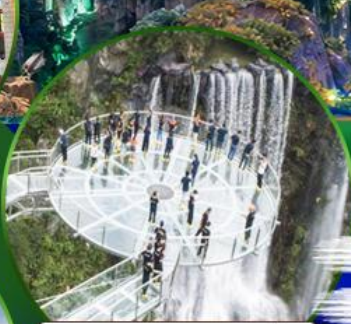
สะพานแก้วคู่หลงเซี่ยะ