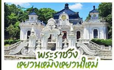
พระราชวัง เขาวงกตเม้งเขาวงกตใหม่