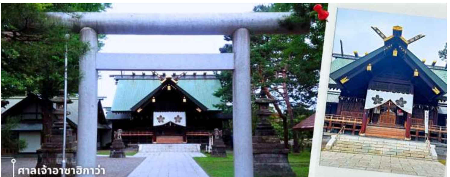
ศาลเจ้าอาซาฮิกาวา

หลังรับประทานอาหารเช้า นำท่านเดินทางสู่ ศาลเจ้าอาซาฮิกาวา เป็นศาลเจ้าชินโตเก่าแก่ประจำเมืองอาซาฮิกาวา จังหวัดฮอกไกโด เป็นศูนย์รวมจิตใจของชาวเมืองและสถานที่ประกอบพิธีตามความเชื่อของศาสนาชินโต ภายในศาล