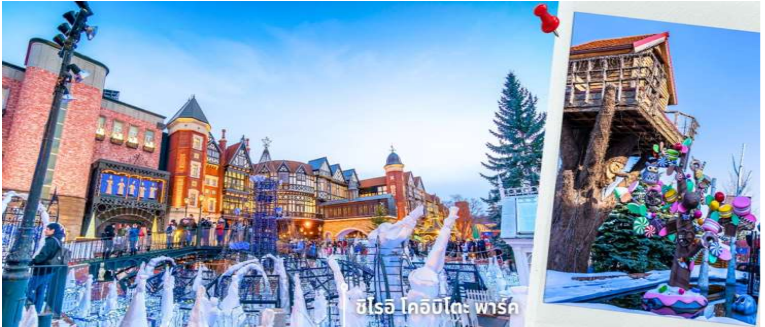
ชิโรอิ โคอิบิตะ พาร์ค

**การประดับไฟในฤดูหนาวและการเปิดไฟขึ้นอยู่กับช่วงเวลาและกำหนดการของสถานที่ ไม่สามารถรับประกันได้ **