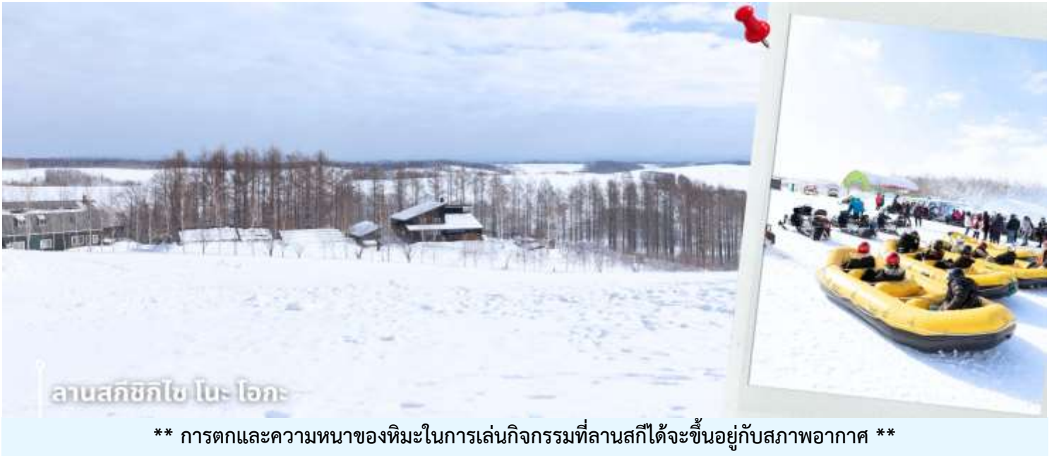
ลานสกีซึกิไซ โนะ โอกะ

ที่ลัดเลาะไปตามเนินหิมะ กิจกรรมขับ สโนว์โมบิลสุดเร้าใจ หรือจะเล่นเลื่อนหิมะและปั้นตุ๊กตาหิมะ ท่ามกลางทัศนียภาพขาวโพลนของเมืองบิเอะ พร้อมชมวิวกุเอาที่สวยงามตระหง่านอยู่เบื้องหลัง