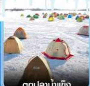
ตกปลาน้ำแข็ง