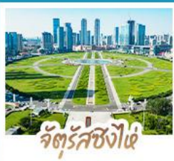
จัตุรัสซิงไ่