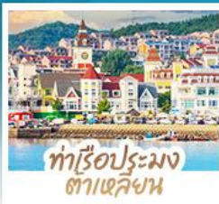
ทำเรือประมง ต้าเหลียน