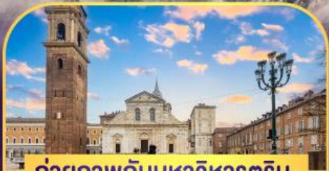
ถ่ายภาพกับมหาวิหารคูริน