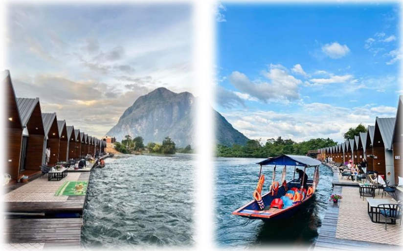
พักที่ แพริเวอร์ไซด์ 2, แพ ที แอนด์ ที, แพ เอ็ม แอนด์ อาร์, แพโรแมนติก หรือเทียบเท่า