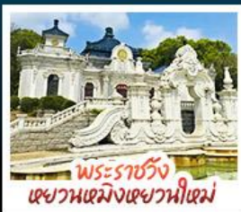
พระราชวัง แชวหนเมิ่งแฉวหนี่เซม