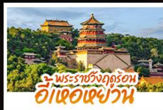
พระราชวังฤดูร้อน อี่เเฮอเฉยวัน