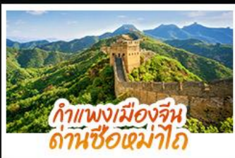
กำแพงเมืองจีน ด่านซือหม่าโต