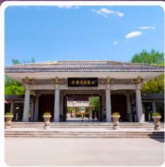
อุทยานประวัติศาสตร์จิวจวน