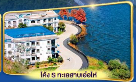
โค้ง S ทะเลสาบเอ๋อไห่