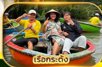
เรือกระดิ่ง