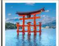
ศาลเจ้าอิตสึคุชิมะ