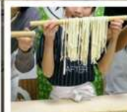
กิจกรรมทำเส้นอุด้ง