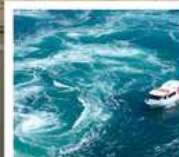
คลองเรือขมบ้านนาสุโตะ

คลองเรือขมบ้านนาสุโตะ / ซุปบึงย่านชินโซบาช / ตลาดปลาคุโรเมง / ซุปบึงย่านอุมาตะ