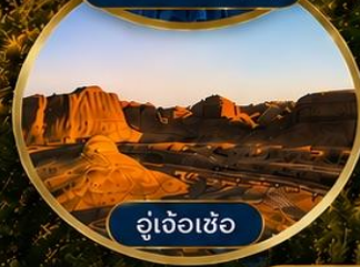
อู่เจ้อเซ่อ