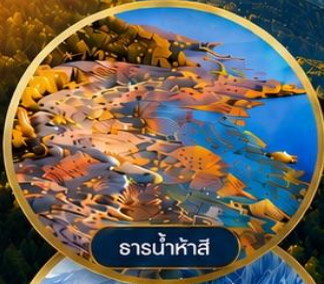
ธารน้ำห้ำสี่