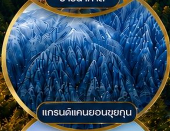
แกรนด์แคนยอนซุยกุน