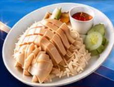
ข้าวมันไก่ปีนัง