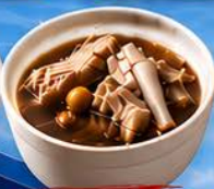
มะกูดเต้