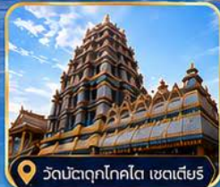
วัดมัตตุกโคตโต เซดเตียร์