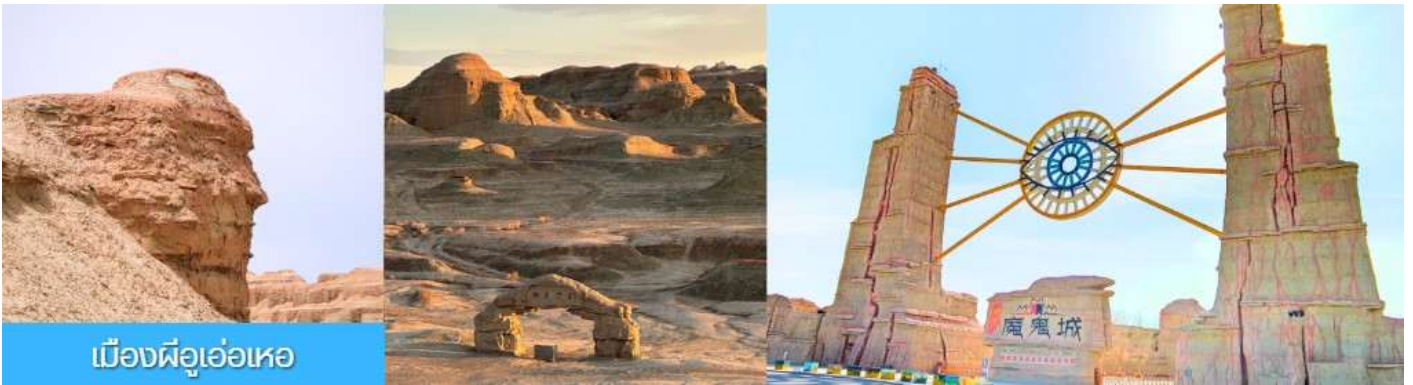
เมืองฝือเอ๋อเหอ

รับประทานอาหารเช้า ณ ห้องอาหารของโรงแรม (13)