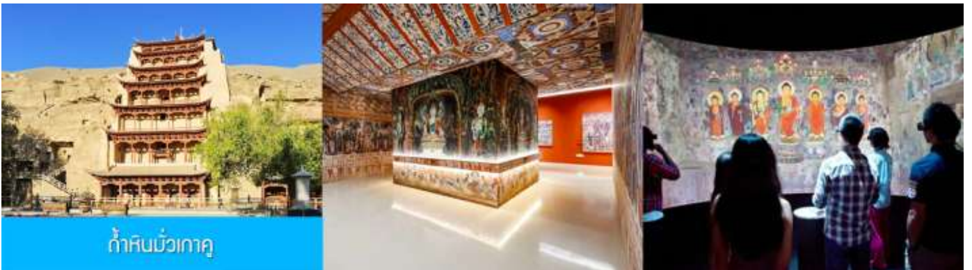
ถ้ำหินมั่วเกา

เช้า รับประทานอาหารเช้า ณ ห้องอาหารของโรงแรม (1)