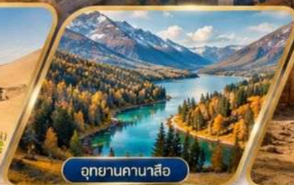
อุทยานคานาสีอ