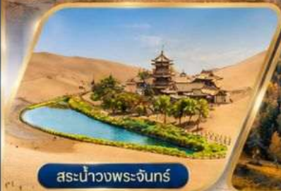
สะพานพระจันทร์