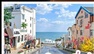
ถนนคอปเปลิ่งสาขาที่เปิด